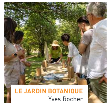
LE JARDIN BOTANIQUE Yves Rocher