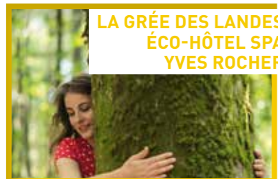
LA GRÉE DES LANDES ÉCO-HÔTEL SPA YVES ROCHER

A L'ACCUEIL DU JARDIN BOTANIQUE La Croix des Archers - La Gacilly