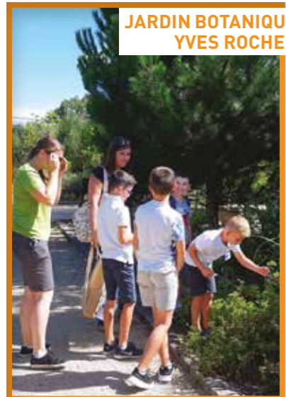
JARDIN BOTANIQUE YVES ROCHER

MAISON YVES ROCHER Le Moulin - Le Bout du Pont - La Gacilly Tél. 02 99 08 37 36 - www.maisonyvesrocher.fr contact@maisonyvesrocher.com BOUTIQUE & INSTITUT boutique-institut@maisonyvesrocher.com RESTAURANT LE VÉGÉTARIUM Également ouvert les jeudis, vendredis et samedis soirs restaurant@maisonyvesrocher.com