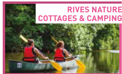
RIVES NATURE COTTAGES & CAMPING

7 J. / 7 sur réservation - Activités payantes