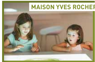
MAISON YVES ROCHER