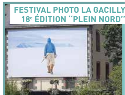
FESTIVAL PHOTO LA GACILLY 18 e ÉDITION "PLEIN NORD"

LA GRÉE DES LANDES ÉCO-HÔTEL SPA YVES ROCHER & SON RESTAURANT GASTRONOMIQUE BIO & LOCALAVORE "LES JARDINS SAUVAGES" Cournon - La Gacilly Tél. 02 99 08 50 50 - Spa : 02 99 93 35 37 resa.hotel@lagreedeslandes.com (hors Expériences Bien-être) www.lagreedeslandes.com